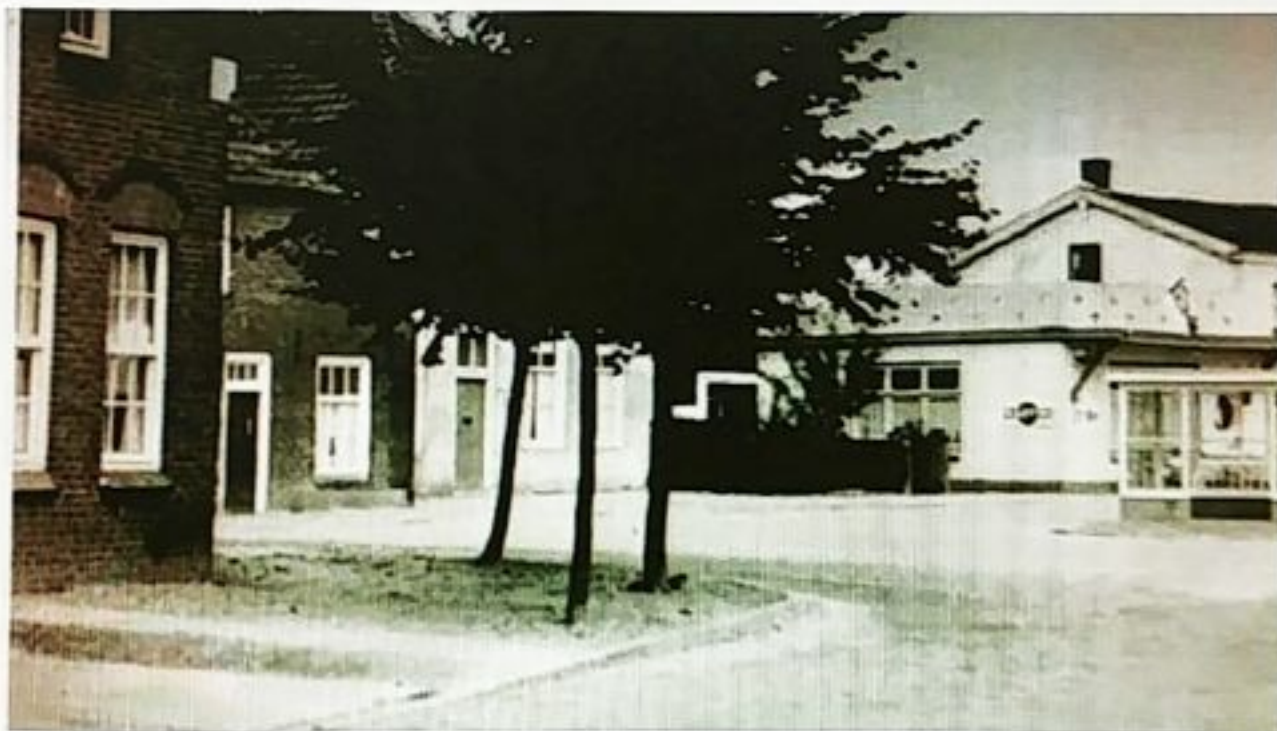
De boerderij achter de bomen was de boerderij van Dorus en Net.

tijd veel boeren deden. Ook op de Gemeentewei op de Woerd pachtte Opa grond.